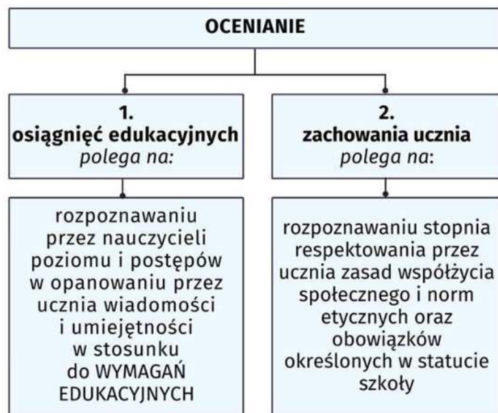
Ryc. 2. Ocenianie osiągnięć edukacyjnych i zachowania ucznia (na podstawie Ustawy z dnia 7 września 1991 r. o systemie oświaty (Dz. U. z 2022 r., poz. 2230 z późn. zm.)

Nauczyciele często wykorzystują przygotowane przez wydawnictwa opracowania podające wymagania edukacyjne z poszczególnych przedmiotów, często też na bazie „gotowego” dokumentu modyfikują go przystosowując do własnych potrzeb. Niektórzy pedagodzy opracowują samodzielnie te wymagania. Nauczyciel ma tu dość dużą swobodę. Przepisy nie wskazują, jak skonstruować wymagania edukacyjne. Ważne, że mają one zostać stworzone, podane do informacji uczniów i ich rodziców. Opisane są przy wykorzystaniu czasowników operacyjnych (np. uczeń: analizuje, bada, diagnozuje, klasyfikuje, interpretuje, ocenia, porównuje, przelicza, wnioskuje, uzasadnia, rozróżnia, objaśnia).