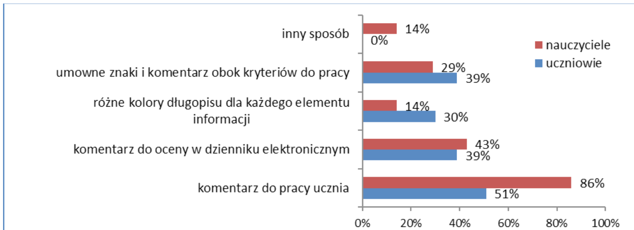
Wykres 1. Najbardziej doceniane przez uczniów sposoby udzielania informacji o osiągnięciach według respondentów

W jaki sposób uzasadnianie ocen pomaga uczniom w dalszej nauce? – to pytanie numer 4. Uzasadnianie ocen motywuje do dalszej nauki – tak uważa 61% uczniów, 51% odpowiedziało, że zwiększa to zainteresowanie przedmiotem, 47% – aktywuje do większej pracy na zajęciach. Uczniowie podkreślali również – 44%, że uzasadnianie ocen sprzyja temu, że chętniej chcą wziąć udział w konkursach przedmiotowych, dla 39% uczniów uzasadnienie oceny ma wpływ na lepsze samopoczucie i większą pewność siebie. 11% badanych twierdzi, że ocenianie bieżące nie ma żadnego wpływu na ich dalszą naukę.