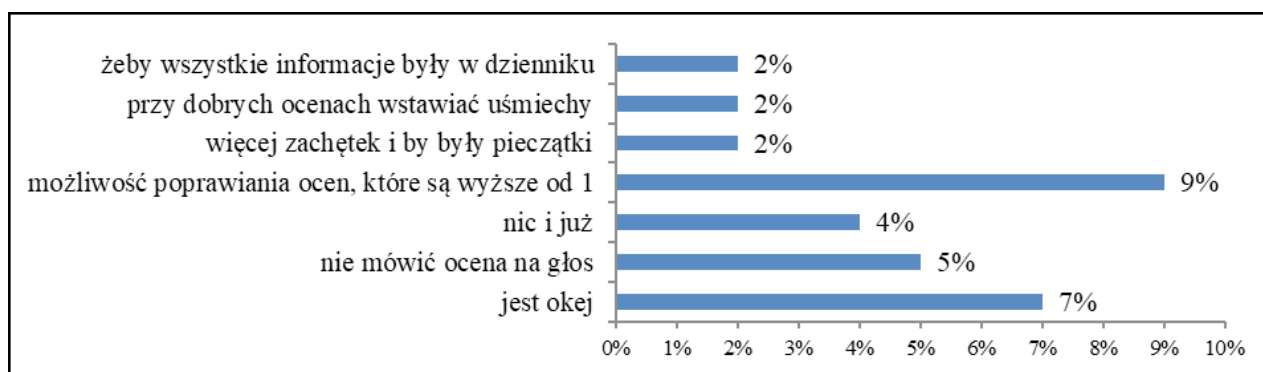
Wykres 4. Propozycje zmian w sposobie przekazywania informacji o osiągnięciach według uczniów

Natomiast wśród nauczycieli pojawiły się pojedyncze propozycje następujących zmian: „wszystkie osiągnięcia uczniów należy pokazywać na forum szkoły”, „więcej doceniać niż wskazywać błędów”, „precyzyjnie (bez ogólników) wskazywać na czym polega popełniony błąd”, „rodzice powinni być na bieżąco informowani o sukcesach i porażkach przez dziennik elektroniczny (po każdej pracy klasowej lub gdy pojawi się konieczność)”. Wyniki przedstawiono na wykresie 4.